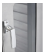
optie- isolatiecontainer- glazen-deur