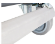
optie- isolatiecontainer- ergonomische- centrale-rem