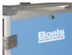
optie- isolatiecontainer- logo